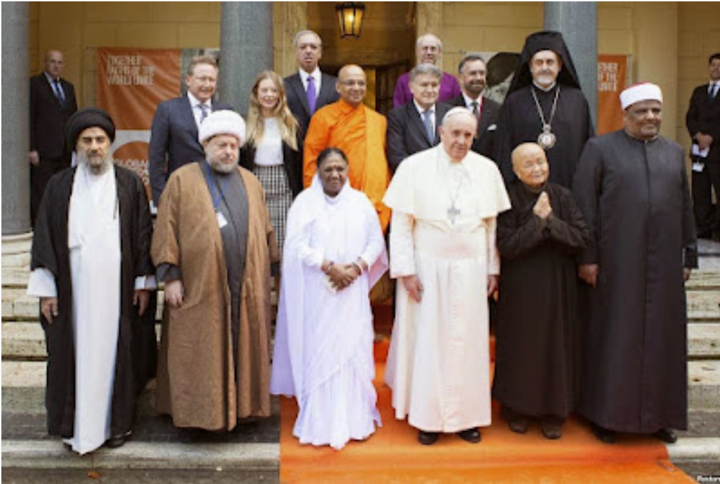
papa akiwa na viongozi wa dini mbalimbali akipalilia wazo la Muunganiko wa dini na madhehebu utakaosaidia kupunguza vitendo vya kighaidi

(papa akiwa na viongozi wa dini mbalimbali duniani)