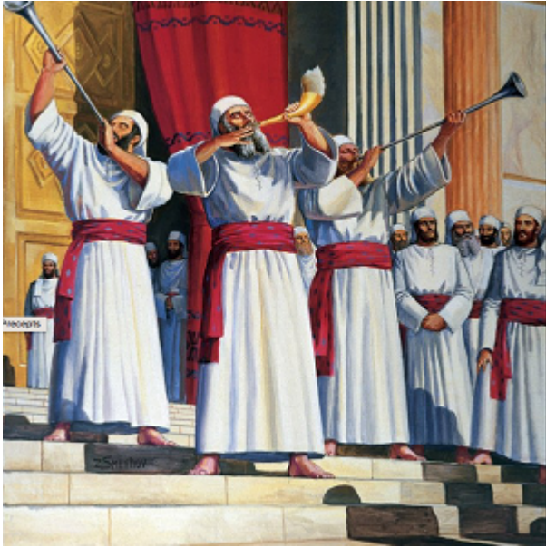
KUOTA MAFURIKO, KUOTA MAJI MENGI, KUOTA MAWIMBI.