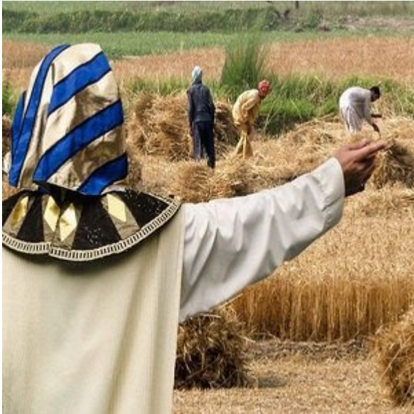
Mti wa Mshita ni mti wa namna gani?