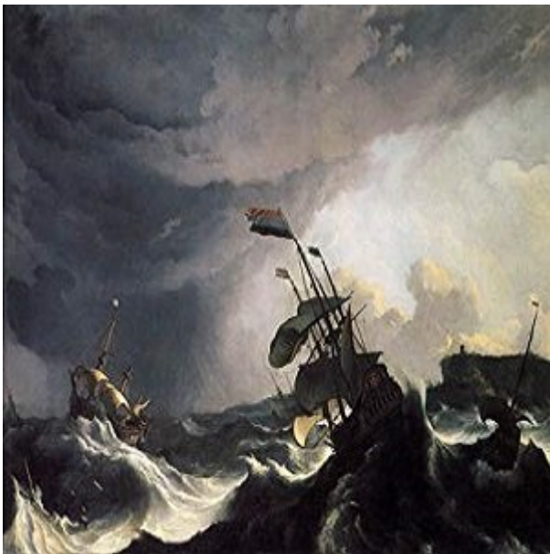
SAA YA KIAMA.