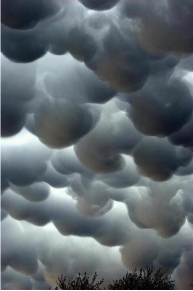
Mvua ya mawe

Mungu alianguka mvua ya mawe kubwa sana, kwa wale watu wa Yerusalemu na wenzake walioungana kupigana na Yoshua kipindi kile wanaenda kuimiliki nchi yao, Utaona baadhi yao waliuliwa na Israeli, lakini wengi wa hao Mungu alimalizia kutoa hazina yake ya mvua kubwa ya mawe ikawaangamiza wengi sana kuliko hata wale waliuliwa na Yoshua.