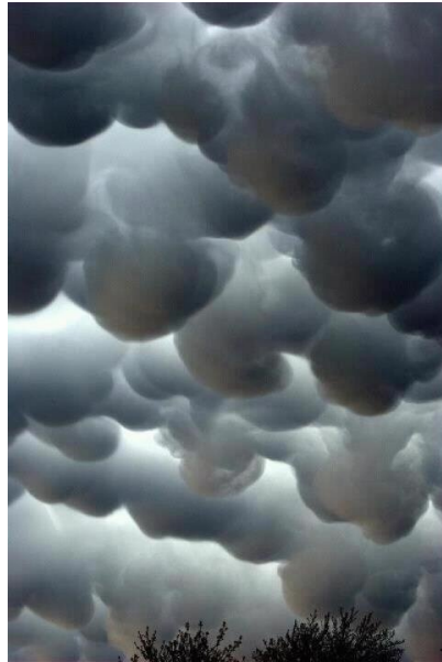
Mvua ya mawe

Mungu alianguka mvua ya mawe kubwa sana, kwa wale watu wa Yerusalemu na wenzake walioungana kupigana na Yoshua kipindi kile wanaenda kuimiliki nchi yao, Utaona baadhi yao waliuliwa na Israeli, lakini wengi wa hao Mungu alimalizia kutoa hazina yake ya mvua kubwa ya mawe ikawaangamiza wengi sana kuliko hata wale waliuliwa na Yoshua.