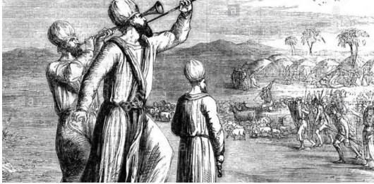
kelele za vita

Bwana hutumia vitisho pia, kuwaondoa maadui, utakumbuka wakati Fulani wana wa Israeli, walizungukwa na maadui kwa muda mrefu. Hadi nchi ikaingwiwa na njaa, watu wakaanza kulana ili waishi. Lakini jinsi Mungu alivyowaondoa maadui zao inashangaza. Kwasababu alifanya tu, kuwasikilizisha sauti za vita. Hivyo wale maadui waliposikia waliogopa sana wakawa wanakimbia kwa hofu kubwa sana huku wanaacha nyara zao nyuma. Baadaye Wayahudi kwenda wanashangaa hawawaoni maadui zao, wakijuliza ni nini kimetokea, mpaka waache na nyara, wakagundua kuwa ni Bwana ndiye aliyewatetea. Ndipo wakazichukua nyara kiwepesi na vita vikawa vimeisha kwa namna ile.