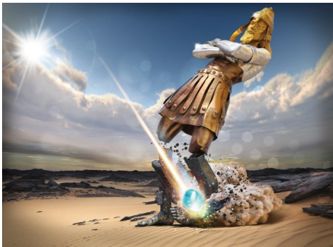
maombi ya vita jiwe la Yesu

Jiwe la Mungu ni Yesu. Yeye mwenyewe alijifananisha na jiwe hilo lililo zito sana na gumu. Akasema. Likimwangukia mtu linamsaga tikitiki, na yoyote atakayeliangukia atavunjika vunjika Kuonyesha ni jinsi gani lilivyo bora, ndio lile lililopiga sanamu ya Nebukadreza, na kuisaga kama unga, na kupotea kabisa(Danieli 2:34).