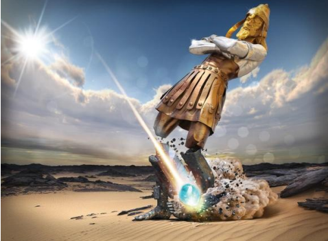
maombi ya vita jiwe la Yesu

Jiwe la Mungu ni Yesu. Yeye mwenyewe alijifananisha na jiwe hilo lililo zito sana na gumu. Akasema. Likimwangukia mtu linamsaga tikitiki, na yoyote atakayeliangukia atavunjika vunjika Kuonyesha ni jinsi gani lilivyo bora, ndio lile lililopiga sanamu ya Nebukadreza, na kuisaga kama unga, na kupotea kabisa(Danieli 2:34).