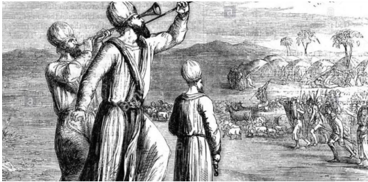
kelele za vita

Bwana hutumia vitisho pia, kuwaondoa maadui, utakumbuka wakati Fulani wana wa Israeli, walizungukwa na maadui kwa muda mrefu. Hadi nchi ikaingwiwa na njaa, watu wakaanza kulana ili waishi. Lakini jinsi Mungu alivyowaondoa maadui zao inashangaza. Kwasababu alifanya tu, kuwasikilizisha sauti za vita. Hivyo wale maadui waliposikia waliogopa sana wakawa wanakimbia kwa hofu kubwa sana huku wanaacha nyara zao nyuma. Baadaye Wayahudi kwenda wanashangaa hawawaoni maadui zao, wakijuliza ni nini kimetokea, mpaka waache na nyara, wakagundua kuwa ni Bwana ndiye aliyewatetea. Ndipo wakazichukua nyara kiwepesi na vita vikawa vimeisha kwa namna ile.