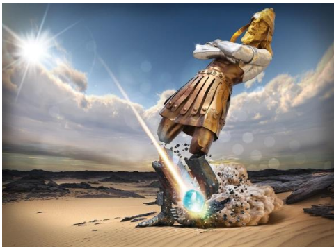
maombi ya vita jiwe la Yesu

Jiwe la Mungu ni Yesu. Yeye mwenyewe alijifananisha na jiwe hilo lililo zito sana na gumu. Akasema. Likimwangukia mtu linamsaga tikitiki, na yoyote atakayeliangukia atavunjika vunjika Kuonyesha ni jinsi gani lilivyo bora, ndio lile lililopiga sanamu ya Nebukadreza, na kuisaga kama unga, na kupotea kabisa(Danieli 2:34).