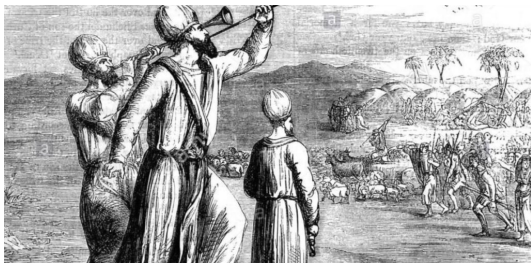
kelele za vita

Bwana hutumia vitisho pia, kuwaondoa maadui, utakumbuka wakati Fulani wana wa Israeli, walizungukwa na maadui kwa muda mrefu. Hadi nchi ikaingwiwa na njaa, watu wakaanza kulana ili waishi. Lakini jinsi Mungu alivyowaondoa maadui zao inashangaza. Kwasababu alifanya tu, kuwasikilizisha sauti za vita. Hivyo wale maadui waliposikia waliogopa sana wakawa wanakimbia kwa hofu kubwa sana huku wanaacha nyara